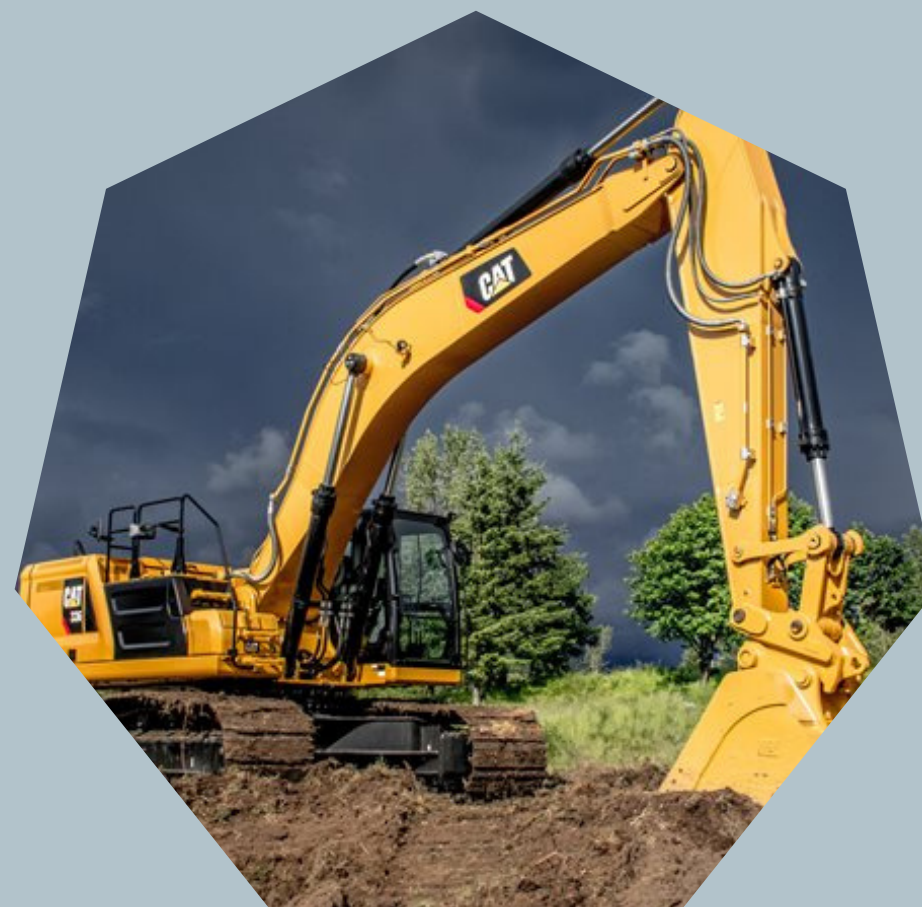
Escavadeiras Hidraulicas CAT 336