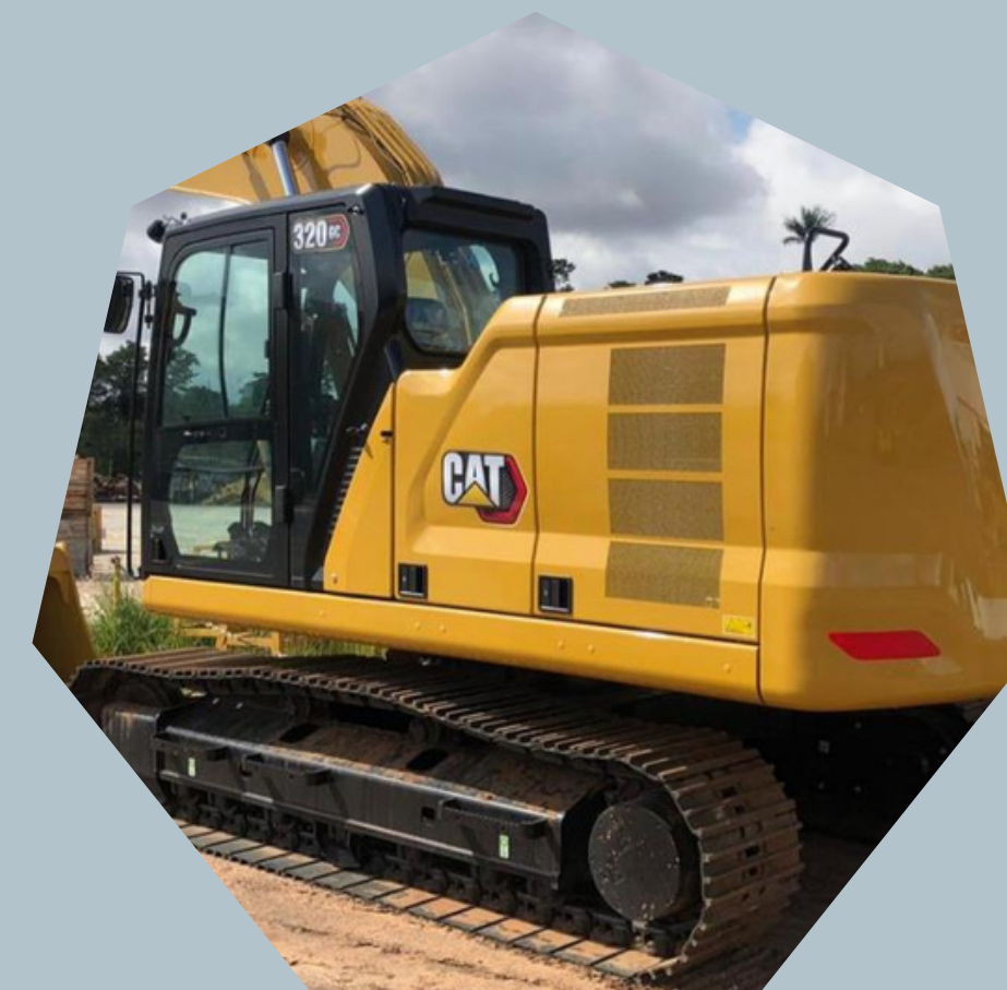
Escavadeiras Hidraulicas CAT 320