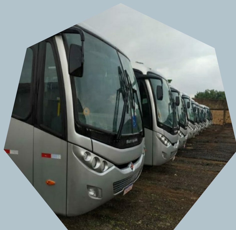
Ônibus MB/Marcopollo (com retarder)