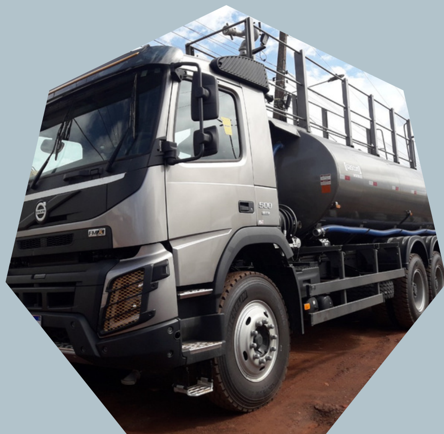
Caminhões Pipa (com retarder)