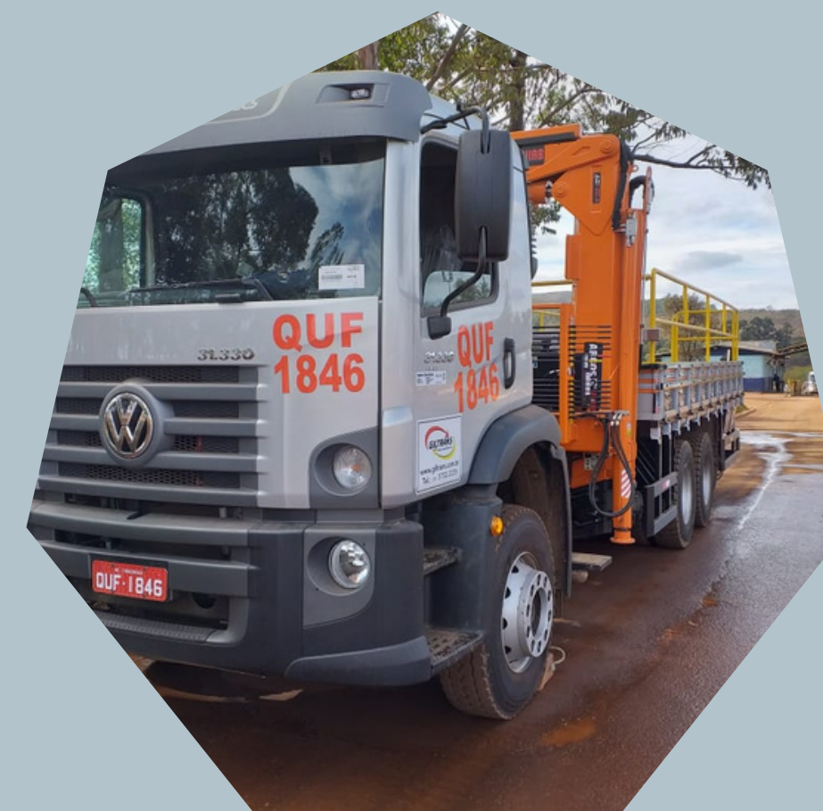
Caminhões Munck (com retarder)