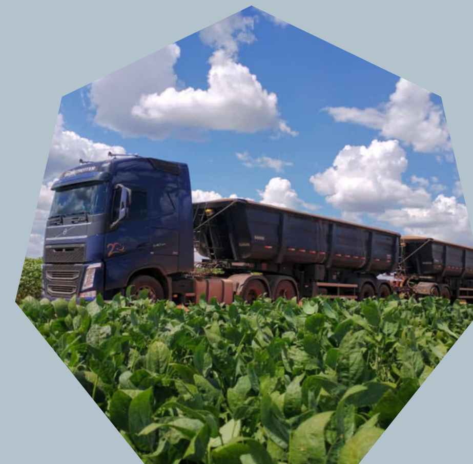
Carretas Basculantes 6X4 (com retarder)