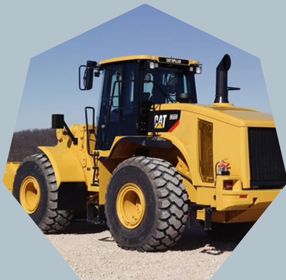
Pás Carregadeiras CAT 966L