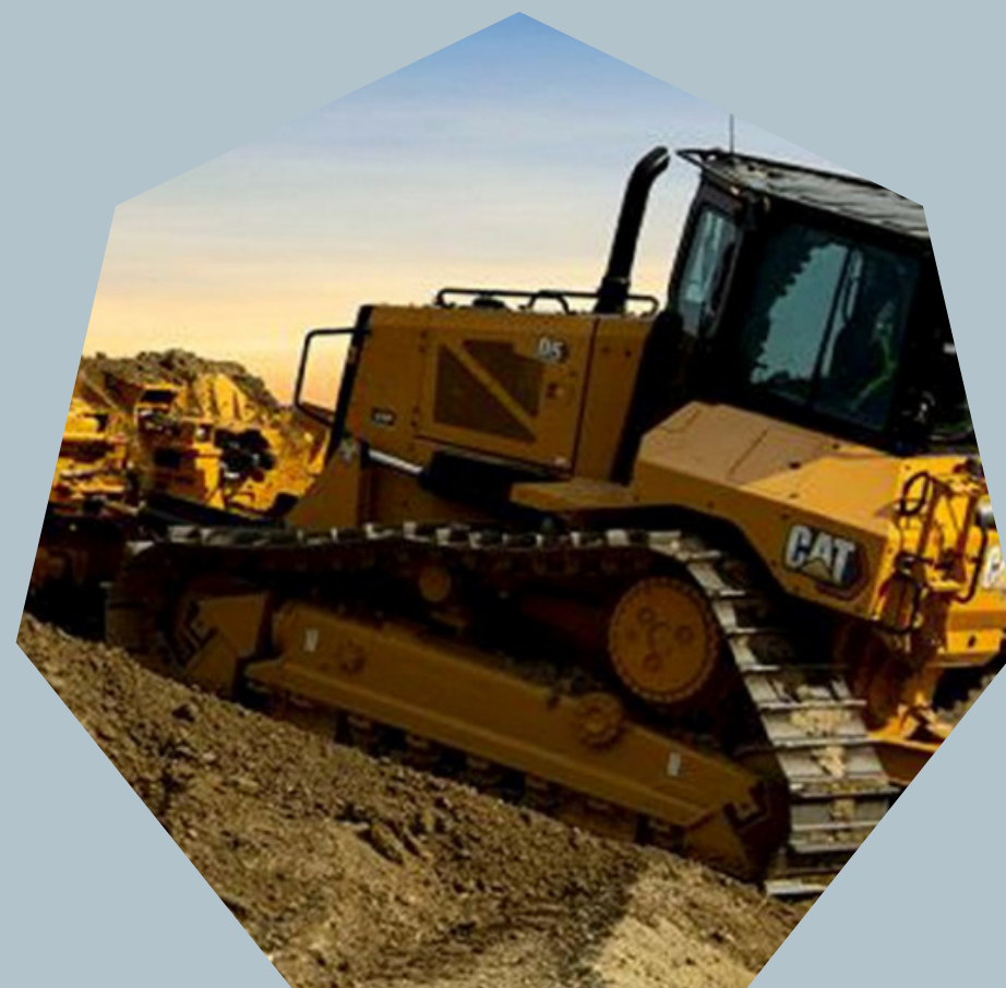
Tratores de esteiras CAT D5/ D6T