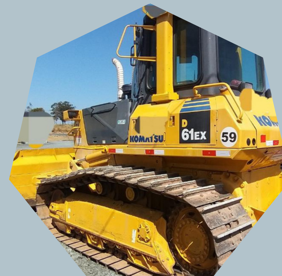
Tratores de esteiras Komatsu D61