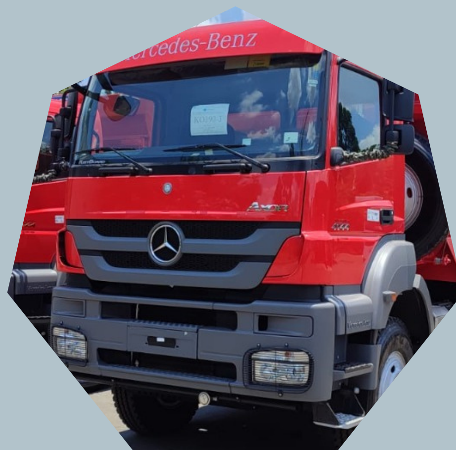
Caminhões MB 6x4 (com retarder)