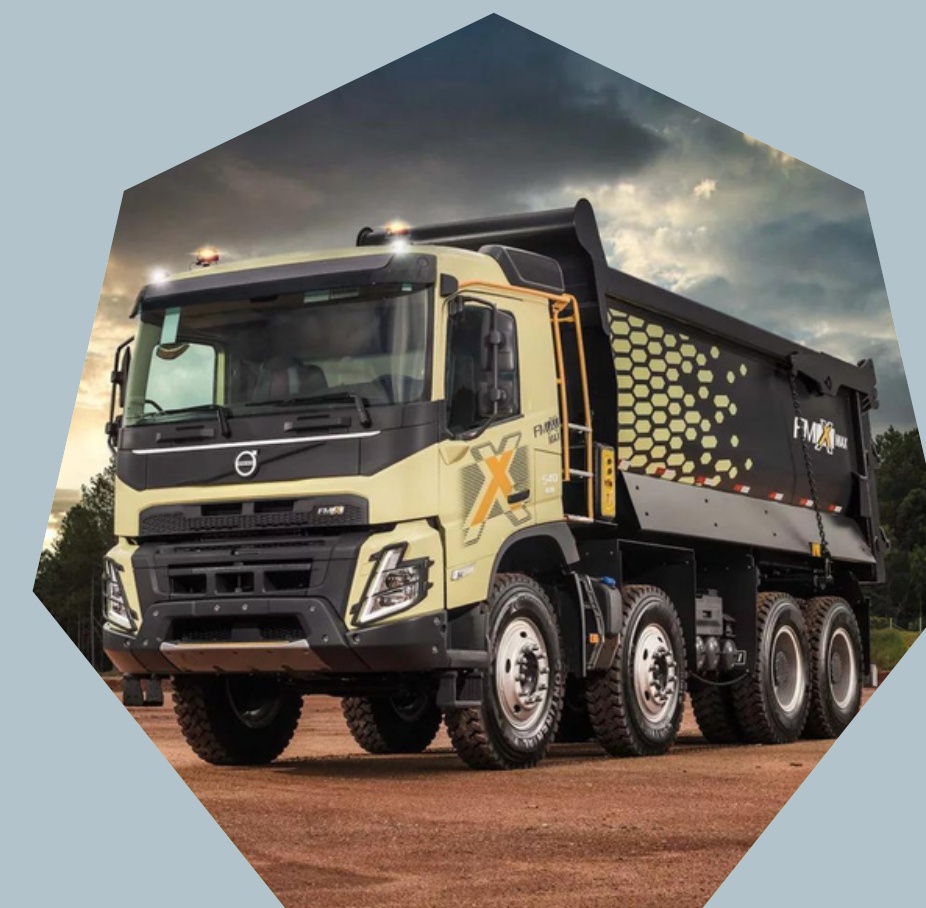
Caminhões Volvo FMX 8X4/ 6x4