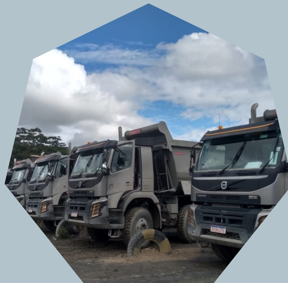
Caminhões Basculantes 6X4 (com retarder)