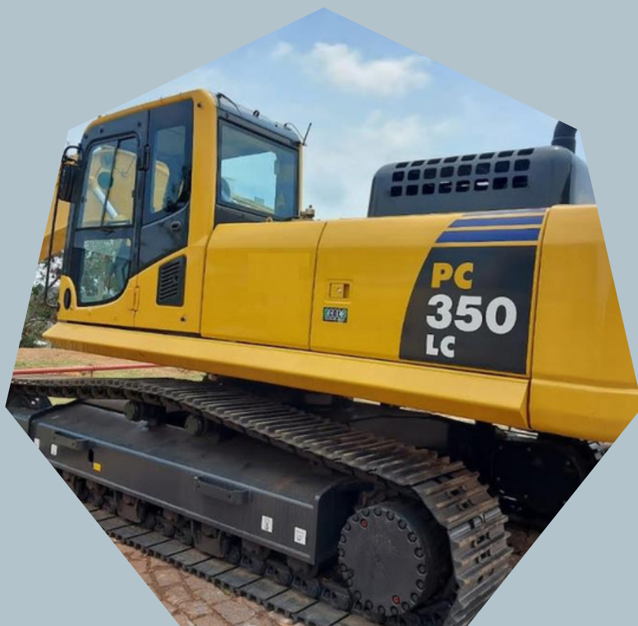
Escavadeiras Hidráulicas Komatsu PC-350